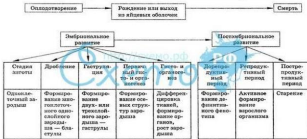
Таблица 20. Периодизация онтогенеза животных организмов