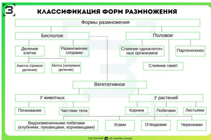
Таблица 4 – Формы размножения