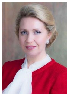
Медведева Светлана Владимировна

Президент Фонда социально-культурных инициатив, председатель Организационного комитета Всероссийской акции "Стоп ВИЧ/СПИД"